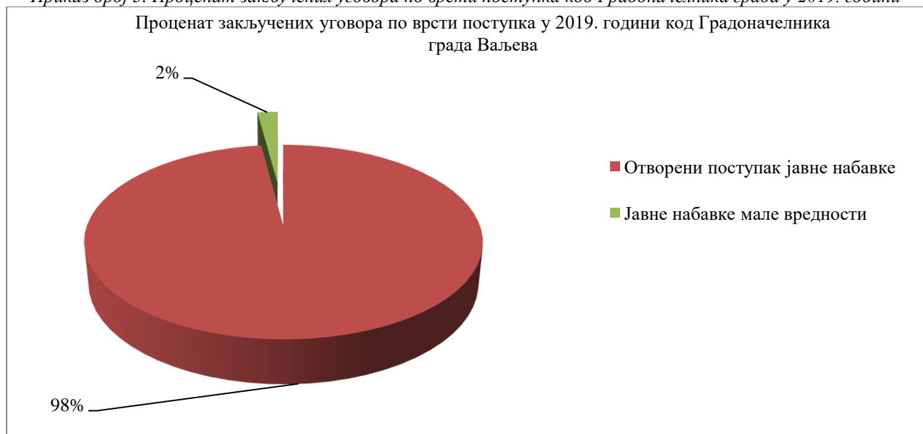
Приказ број 3. Процент закључених уговора по врсти поступка код Градоначелника града у 2019. години