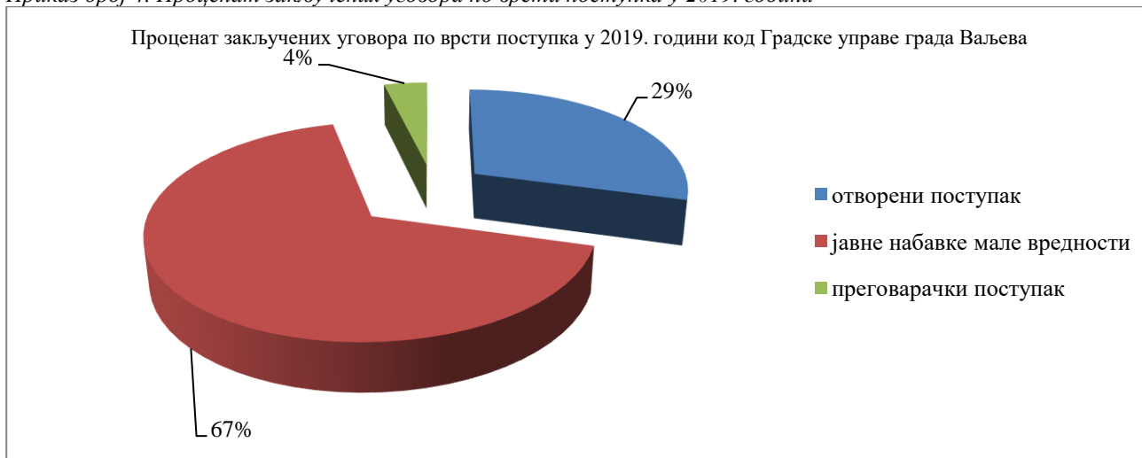
Приказ број 4. Процент закључених уговора по врсти поступка у 2019. години