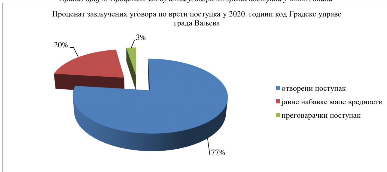
Приказ број 5. Процент закључених уговора по врсти поступка у 2020. години